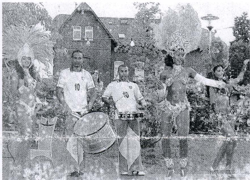
Begeisterter Beifall gab es für die Samba-Show.